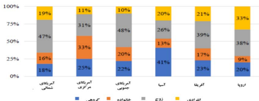
نمودار شماره ۱- ترجیح سفر برای گردشگران ماجراجو بر اساس منطقه جغرافیایی