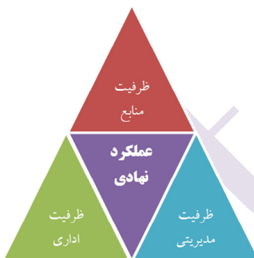
شکل شماره ۲: ابعاد ظرفیت برای عملکرد نهادی (Masum, ۲۰۱۱: ۳-۴)

همچنین ظرفیت اشاره به توان فرد و گروه برای به عمل آوردن مسؤولیت‌ها دارد. بنابراین ظرفیت صرفاً توانایی افراد نیست، بلکه این اصطلاح به معنی اندازه وظیفه، منابعی که برای انجام وظیفه لازم است و چارچوبی که ظرفیت در درون آنها شکل می‌گیرد، است (Frank, ۱۹۹۲: ۵۲).