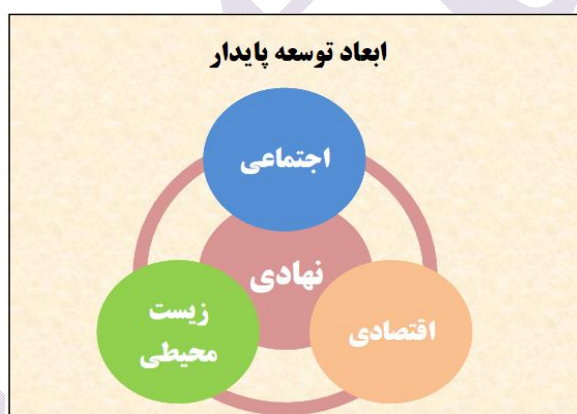
شکل شماره ۴: ابعاد توسعه پایدار

بنابراین با توجه به موارد فوق الذکر می‌توان گفت ارزش مفهوم توانایی و ظرفیت نهادی در این است که در صورت توجه به آن، بصیرت لازم در خصوص تدوین راهبردها، سیاست‌ها و الگوهای توسعه پایدار محلی را شکل بخشیده و ضمن جهت دادن به تغییرات اساسی در ابعاد نهادی، بسترهای شناخت لازم را برای درگیر کردن هر چه بیشتر عوامل محلی در روند توسعه را فراهم می‌کند. شکل شماره ۴ نشان می‌دهد که امروزه نهاد و بهره‌گیری از ظرفیت آن به عنوان یکی از ابعاد توسعه پایدار مطرح است.